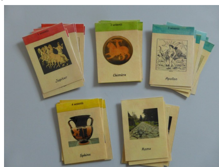
Cartes « titres de propriété »

Si la réponse est juste, il peut acquérir le terrain en payant le prix indiqué sur la case du plateau de jeu. Mais s'il ne répond pas correctement à la question, il ne peut pas acquérir le terrain. S'il retombe dessus au tour suivant et qu'il répond juste, il pourra l'acheter. Le paiement se fait à la banque, l'Argentaria, et le joueur en échange reçoit le titre de propriété correspondant.